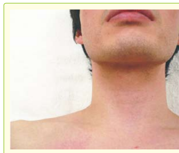
図2 内頸静脈の視診 検査者の視点である。頸部を接線方向に観察し、静脈拍動を探す。