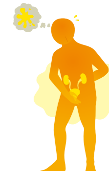
表紙イラスト/齋藤州一