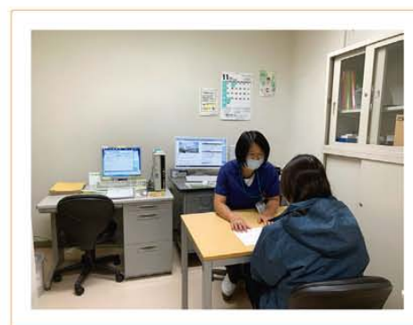
図2 血糖自己測定データを用いた療養指導

本的な勘違いや誤りがないか、患者の自己流になってしまっていないか、なども確認している。療養指導で知り得た情報は、すみやかに担当医師ならびに療養支援室の看護師と共有することで、診療に役立てている。入院患者は、教育入院中にSMBG 機器教育を行い、退院時にデータ管理、次回外来診察までの試薬在庫管理を行っている。