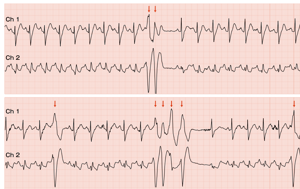
図 4-2 来院時ホルター心電図：基本調律は洞調律で，総心拍数 106, 199 回/日，最小心拍数 54 回/分，最大心拍数 157 回/分，平均心拍数 84 回/分，PVC 2202 回/日，最大 4 連発 (↓) でした。

ました。来院時の心電図 (図 4-1) で右前胸部誘導にて coved 型の ST 上昇，ホルター心電図 (図 4-2) で非持続性心室頻拍を認めたため，当科紹介になりました。前述の心電図所見と前失神歴より，精査加療目的で入院となりました。